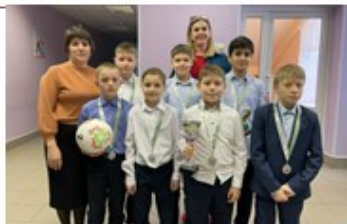
ВСЕГДА НА ВЫСОТЕ!