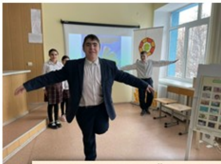
МЕЖДУНАРОДНЫЙ ДЕНЬ РОДНОГО ЯЗЫКА