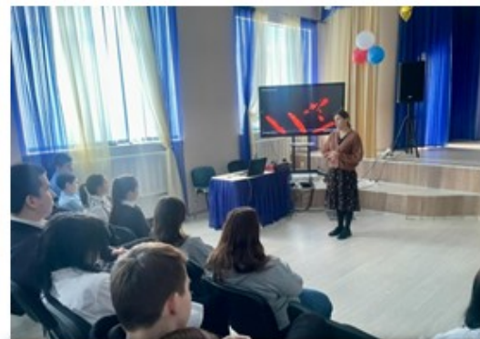
ФИЛЬМ «ЗА ПРЕДЕЛОМ»