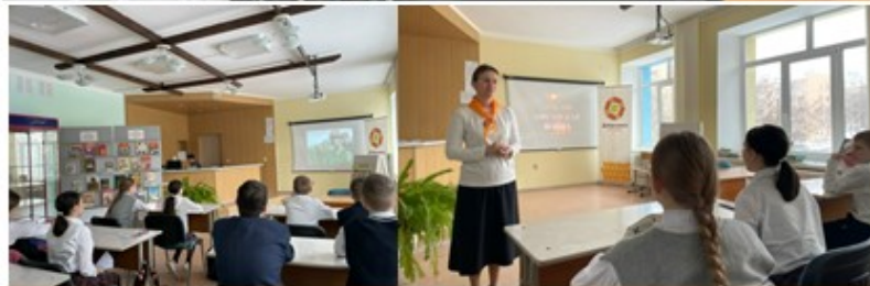
ДЕНЬ ПАМЯТИ О РОССИЯНАХ, ИСПОЛНЯВШИХ СЛУЖЕБНЫЙ ДОЛГ ЗА ПРЕДЕЛАМИ ОТЕЧЕСТВА